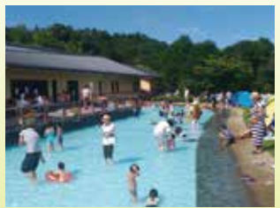
ジャブジャブ池 深さ20cmの池。小さな子供に人気です。

公園のご案内 ■公園概要 所在地 ●愛甲郡愛川町半原 開設面積 ●51.8ha ■パークセンター 開館時間 ●8時30分～17時(4～9月) 8時30分～16時30分(10～3月) 休館日 ●年末年始