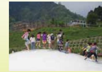
子供広場・フワフワドーム 空気でふくらんだ大きなトランポリンです。