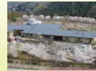
パークセンター 公園や周辺の情報などが得られます。