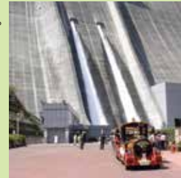
宮ヶ瀬ダム(観光放流)