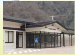
愛川町郷土資料館 ふるさとの資料の収集・保存・展示を行っています。