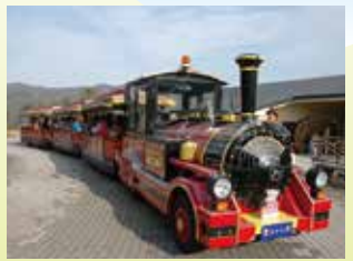
ロードレイン「愛ちゃん号」 公園と宮ヶ瀬ダムを結びます。(有料)