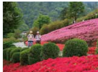
花の斜面 約40種類ものツツジがあり、園内全体では約44,000本が楽しめます。