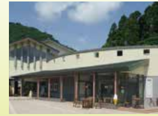
工芸工房村 工芸が体験できる施設で、軽飲食コーナーもあります。