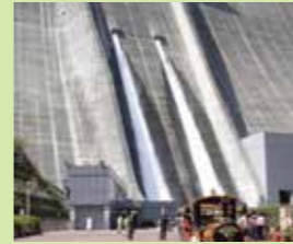
Miyagase Dam (pagbuhos sa tubig ng dam para sa mga turista)