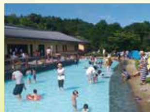
Estanque "Yabu Yabu" Estanque de 20 cm de profundidad. Tiene mucha acogida entre los niños pequeños.