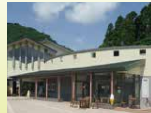
Taller de manualidades Es una instalación en la que se puede experimentar la elaboración de artesanía, además hay un puesto de comida ligera.