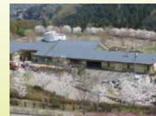
Centro de información del parque En el centro se puede obtener la información del parque y sus alrededores.