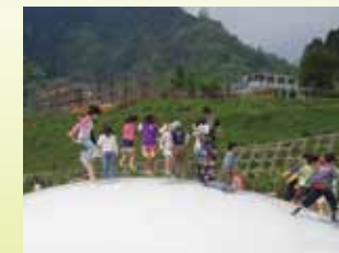
Plaza infantil y Cúpula esponjosa Es un gran trampolín inflado con aire.