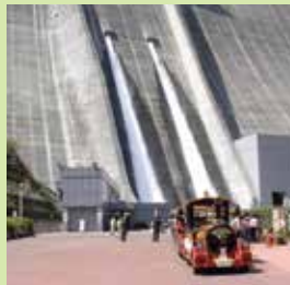
Represa Miyagase (Turismo para ver la descarga de la p1resa)