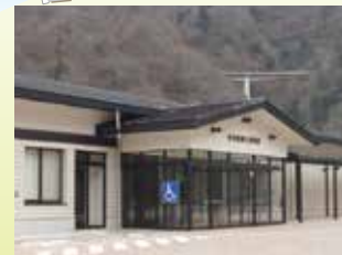
Museo regional de documentación sobre la ciudad de Aikawa Se realiza las actividades de recolección, conservación y exhibición de la documentación sobre el pueblo de Aikawa.