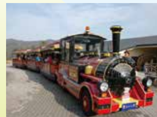
Tren de carretera "Ai chan" Conecta el parque con la represa Miyagase. (No es gratuito)