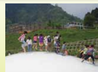
儿童广场/松软圆屋顶 空气膨胀鼓起的蹦床。