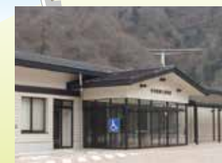
爱川町乡土资料馆 收集、保存和展示乡土的资料。