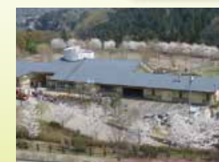
公园中心 可获取公园和周边等的信息。