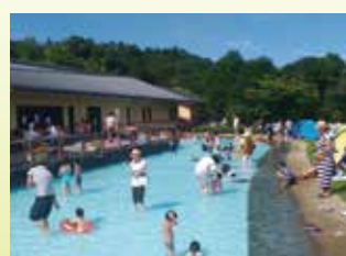
哗啦啦水池 深度为20cm的水池受到年幼孩童喜爱。

公园指南 公园概要 所在地：爱甲郡爱川町半原 开设面积：51.8ha 公园中心 开馆时间： 8点30分~17点(4月~9月) 8点30分~16点30分(10月~3月) 休馆日：年底年初