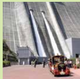
宫濑水坝(观光放水)