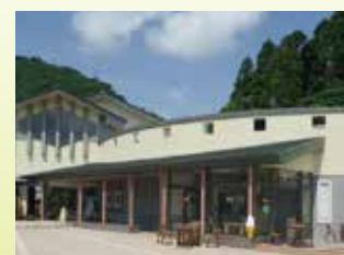
工艺作坊村 能体验工艺的设施，也设有轻便餐饮角。