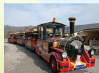
公路列车“阿爱号” 在公园和宫瀨水坝之间运行。(收费)