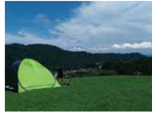
风之丘 从景致优美的山丘，在空气清澈的日子，也可眺望到横滨地标塔。